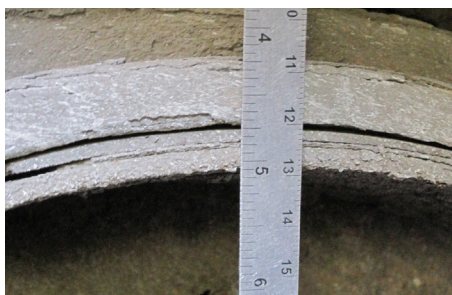
Forro de balata desgastado. OOSC, Parte II, a.(5)(c)vii / 393.47(d)(2)-U.S.