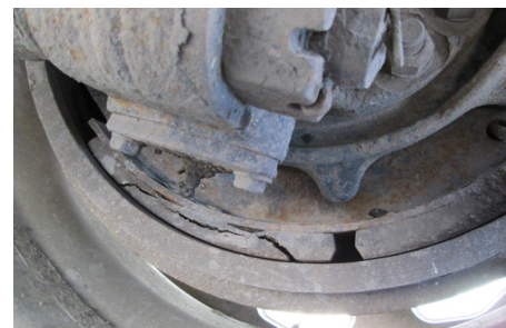
Forro de balata agrietado. OOSC, Parte II, a.(5)(c)iii / 393.47(a)-U.S.