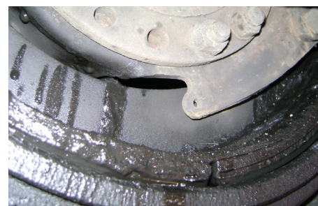
Forro de balata contaminada. OOSC, Parte II, a.(5)(c)vi / 393.47(a)-U.S.