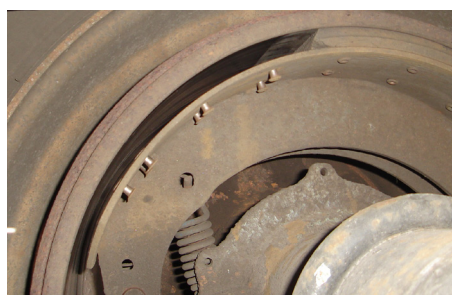
Bloque de forro de balata faltante. OOSC, Parte II, a.(5)(c)ii / 393.47(a)-U.S.

Para más información, visite OperationAirbrake.org .