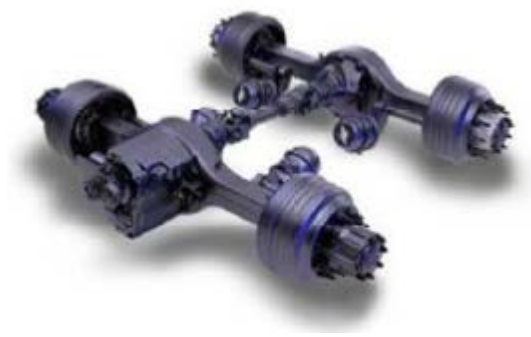
Système 6x4 (Figure 1)

Un tracteur conventionnel est considéré comme muni d'un système 6X4 (figure 1). Ce qui veut dire que des 6 roues ou ensembles de roues présentes sur le véhicule 4 servent à la propulsion du véhicule, pour ainsi dire 2 essieux propulseurs. Un système 6x2 (figure 2) possède aussi 6 roues ou ensembles de roues, mais seulement 2 servent à la propulsion, donc muni d'un seul essieu propulseur. L'essieu restant à l'arrière n'est pas considéré comme propulseur, il ne présente aucune pièce de propulsion (arbre de transmission, engrenages de différentiel, etc.) ou il n'est pas muni d'un boîtier de différentiel. Dans les 2 cas, cet essieu ne fournira pas de propulsion au véhicule. L'essieu non propulseur pourrait se situer le premier essieu du tandem mais dans la majorité des cas il est situé à l'arrière.