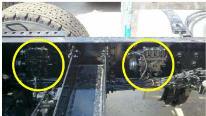
Soupapes actionneur (figure 3)